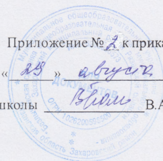
ГРАФИК выдачи пищи Федоровским дошкольным группам МОУ «Безлыченская СОШ»